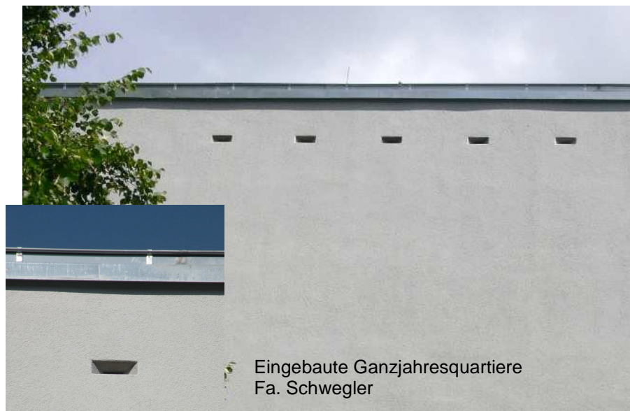
Eingebaute Ganzjahresquartiere Fa. Schwegler