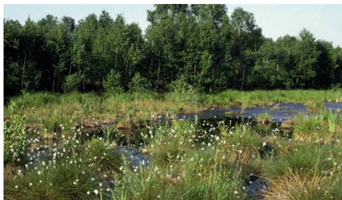
oben: Torfabbau im Moor; unten: naturnahes Moor